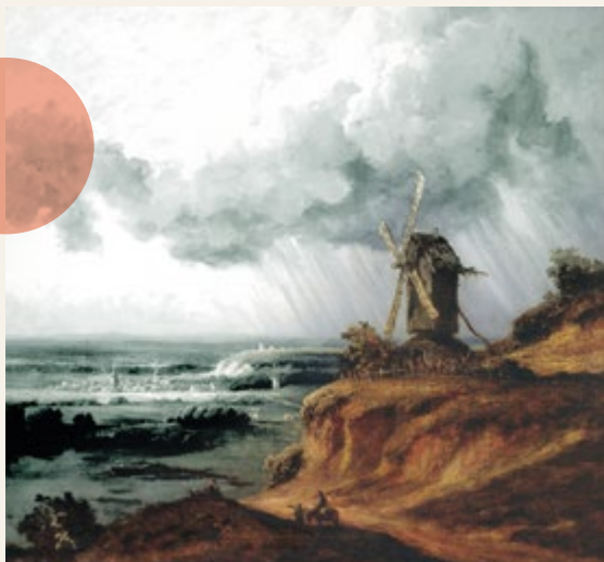
Georges Michel (1763 – 1843), Le moulin d'Argenteuil , vers 1880, huile sur toile, musée des Beaux-arts de Pau

Du 18 sep. 2021 au 23 jan. 2022 Paysage(s) Argenteuil